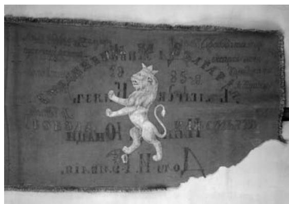
2 с. Голямо Конаре 1885 г.