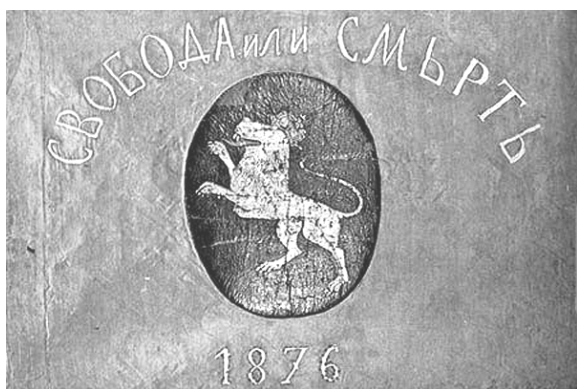
1 Горна Оряховица 1876 г.