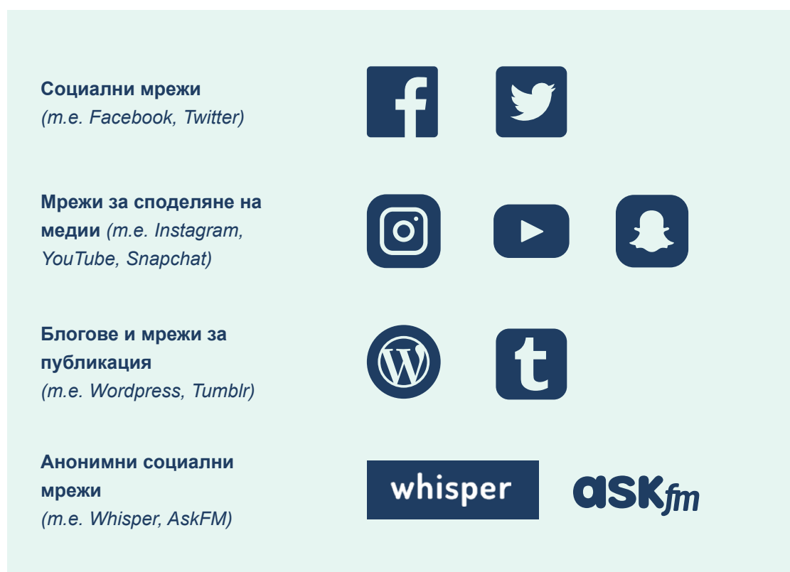
Таблица 4: Някои примери за социални мрежи

Може също така да бъде полезно идентифицирането на различните категории социални мрежи и да се обсъди как те работят, каква е аудиторията им и защо хората ги използват. Социалните мрежи включват: