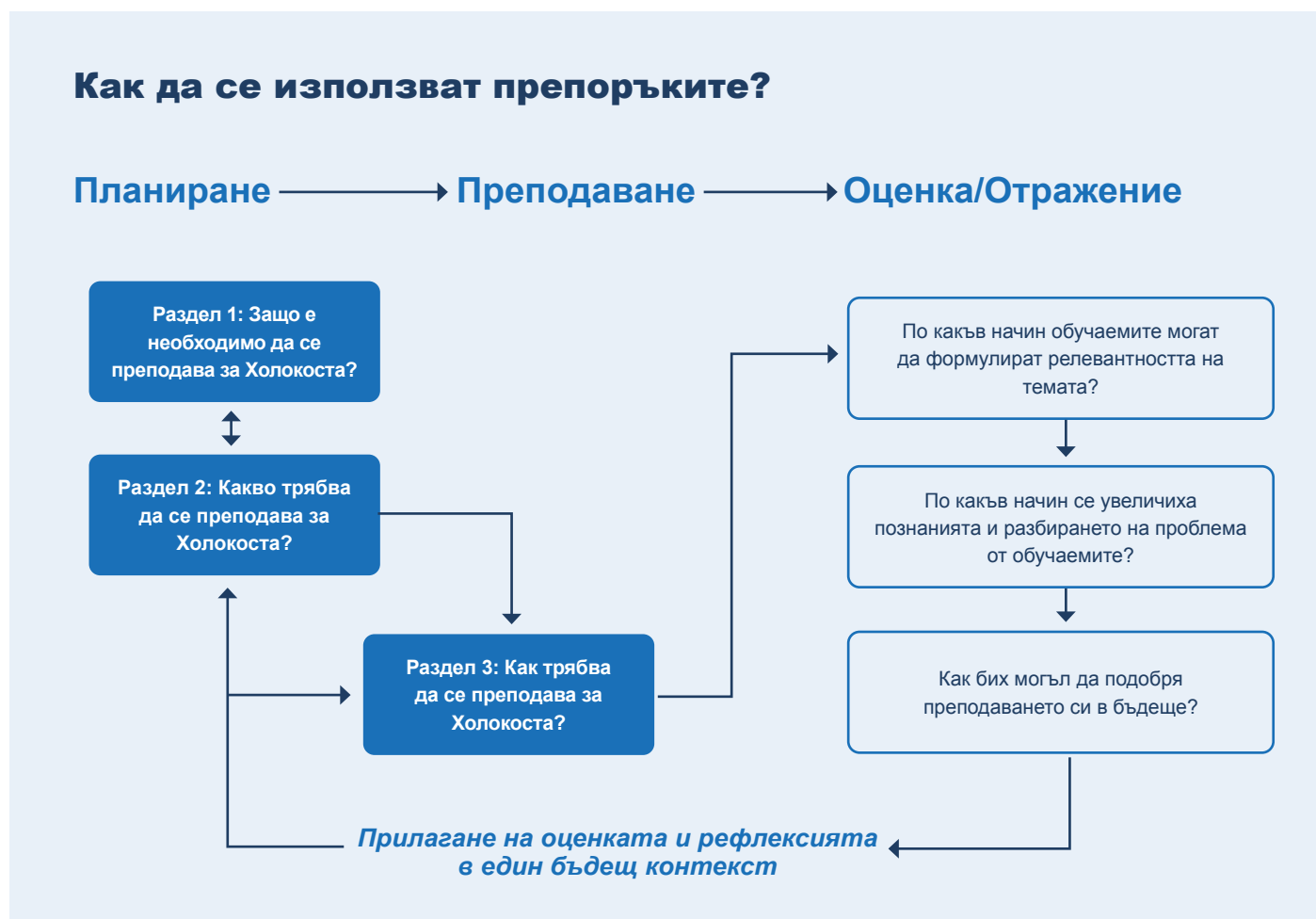
Схема 1: Как да се използват тези препоръки.

На преподавателите се препоръчва да прочетат раздели 1 и 2, преди да пристъпят към планиране на съдържанието на своя урок (уроци) и да прочетат раздел 3, когато трябва да изберат своя подход за преподаване. Раздел 3 може да бъде използван от тях за анализ и оценка на собственото им преподаване, след като вече за изнесли урока (уроците). По този начин препоръките ще бъдат от полза за всички преподаватели, независимо от опита, който имат в преподаването и изучаването на Холокоста. Диаграмата по-долу представлява модел на процеса.