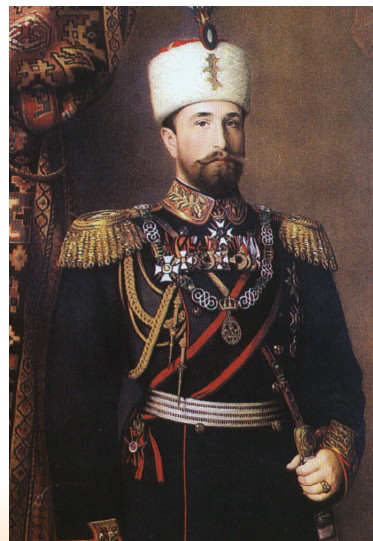
Княз Александър I (1879 – 1886)

Манифестът на цар Фердинанд за обявяване на независимостта