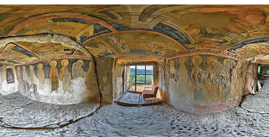
Скалните църкви при с. Иваново, Русенско, XIV в.