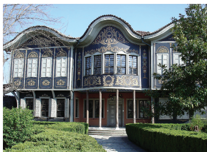
Куюмджиевата къща в Пловдив, 1817 г.

Внимавайте вие, читатели и слушатели, роде български, които обичате и имате присърце своя род и своето българско отечество... Четете и знайте, за да не бивате подигравани и укорявани от други племена и народи... Преписвайте тая историѝца... и пазете я да не изчезне! Но някои не обичат да знаят за своя български род, а се учат да четат и говорят по гръцки и се срамуват да се нарекат българи. О, неразумни и юроде! Защо се срамуваш да се наречеш българин и не четеш, и не говориш на своя език? Или българите не са имали царство и държава? Толкова години са царували и са били славно и прочути по цялата земя... От целия славянски род първо те са се нарекли царе, първо те са имали патриарх, първо те са се кръстили... и първите славянски светци просияли от българския род и език.