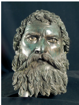
Бронзова глава на огрския цар Севт III