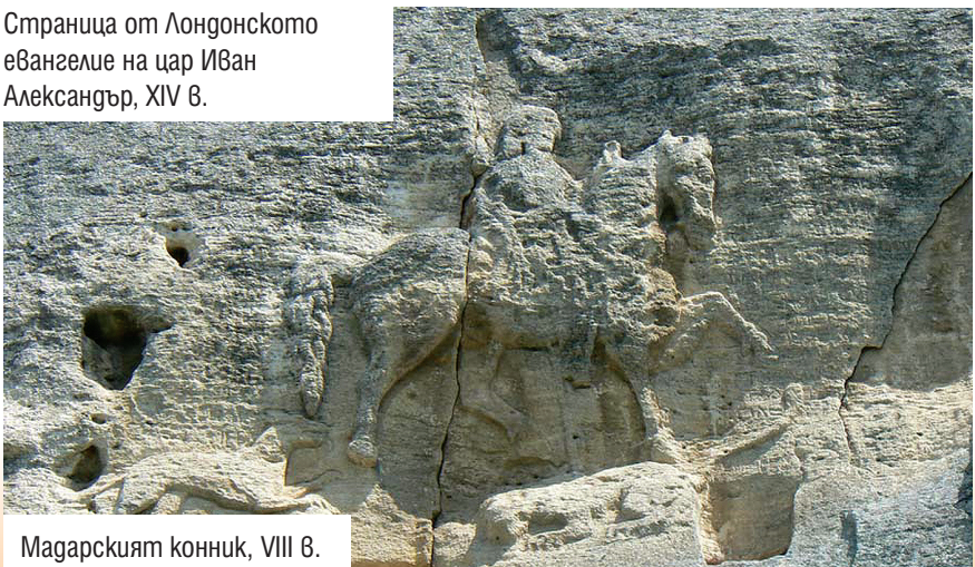
Магарският конник, VIII в.