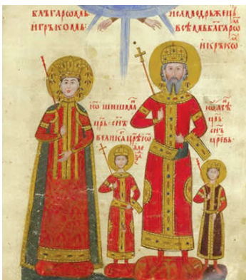
Страница от Лондонското евангелие на цар Иван Александър, XIV в.