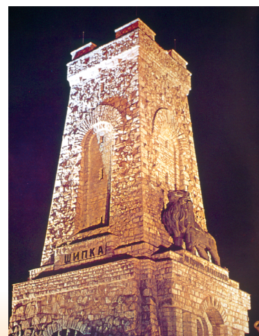
Паметникът на Шипка