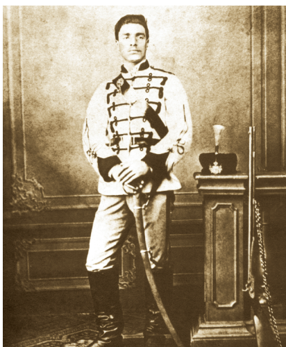
Васил Левски в униформа

Васил Левски. Из „Нареда на работниците за освобождение на българския народ“, 1871 г.