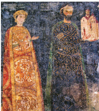
Стенопис от Боянската църква, XIII в.