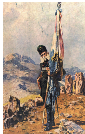
Самарското знаме – худ. Ярослав Вешин, 1911 г.

Който иска народна свобода, свободна държава и човешки правдини, той трябва да се приготви мъжки и да употреби всичките си сили, всичките си старания и всичките си средства, които са потребни за бой, т.е. да прежали живота си... Освен това, българското движение трябва да стане извънредно, а не отвън, както то биваше досега, защото напразно ще се пролива българската кръв... И така, нека младите, умните и честните глави въстанат, за да обновим българския живот... Братя българи! Вярвайте в своите сили и надейте се на своите мишници! От нас зависи спасението на България.