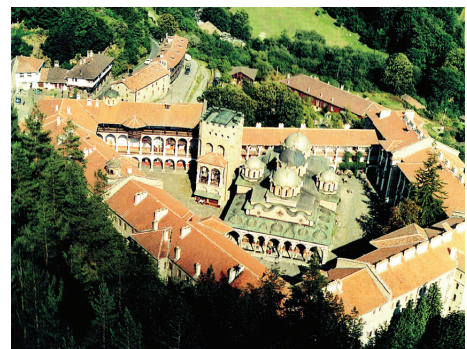
Рилският манастир, основан през X в.