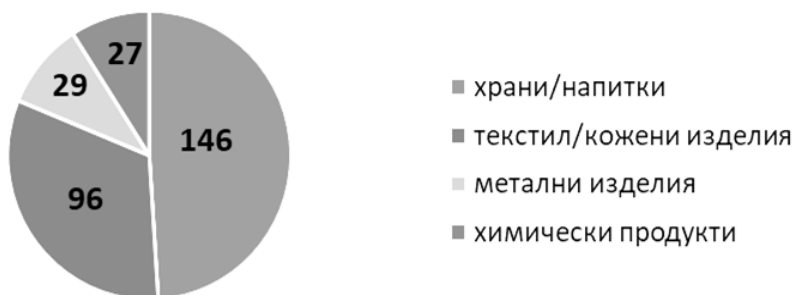
Промишлено развитие на България в началото на XX век (брой предприятия)

36. Какъв извод за състоянието на българската промишленост може да се направи от диаграмата?