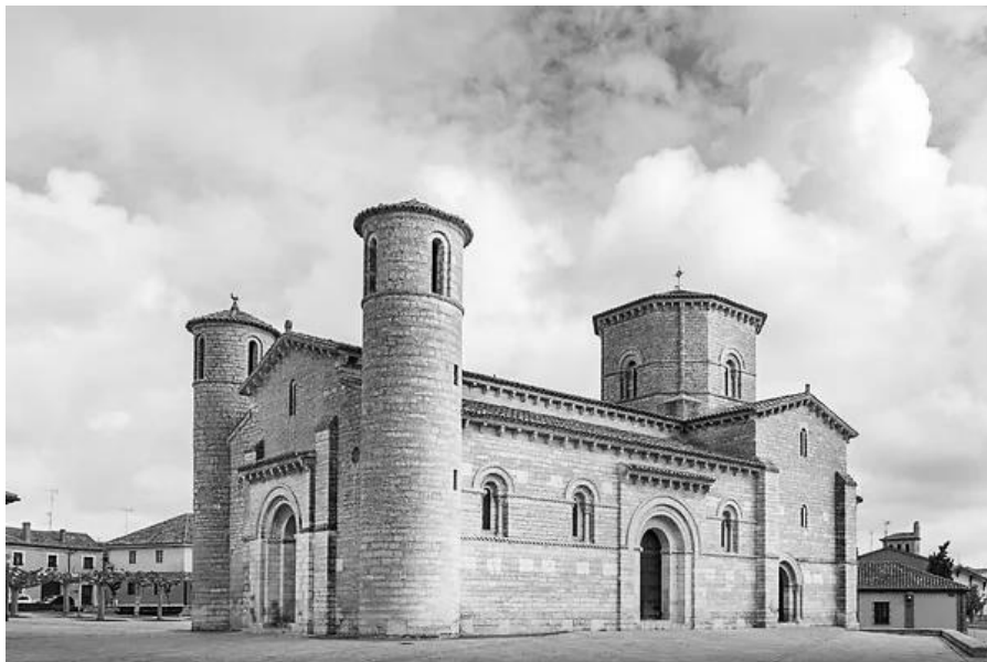
Храм „Сан Мартин де Турс“, Фромиста, (Испания), XI в.