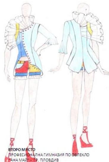
ВТОРО МЯСТО ПРОФЕСИОНАЛНА ГИМНАЗИЯ ПО ОБЛЕКЛО “АНА МАЙ” - ГР. ПЛОВДИВ